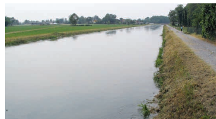
Il canale Vacchelli