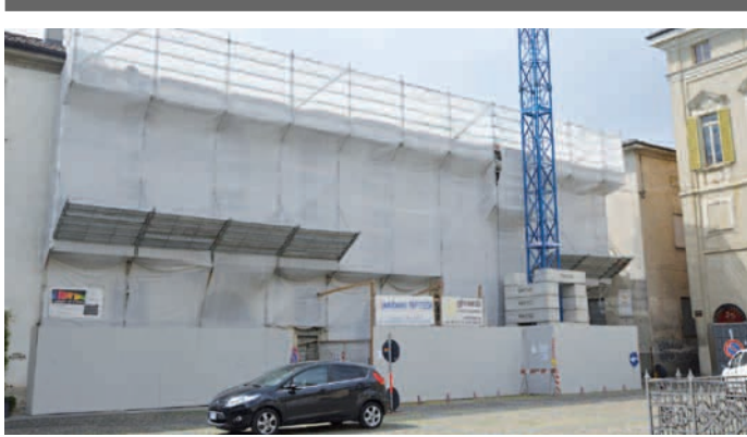
EX RUMÌ - PIAZZA TRENTO E TRIESTE

■ La piazza Trento e Trieste potrebbe diventare il salotto della città. Su questa piazza infatti si affacciano il teatro San Domenico e il mercato Austroungarico: progetti di rilancio culturale di questa zona e soprattutto dei porticati dello storico mercato sono già stati avviati dall'amministrazione comunale. La ristrutturazione del palazzo "ex Rumi" si innesta in questa operazione di rigenerazione urbana di una piazza importante per il centro cittadino.