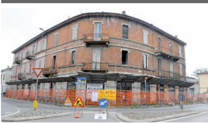
PALAZZO DI VIA CADORNA

■ La piazza Trento e Trieste potrebbe diventare il salotto della città. Su questa piazza infatti si affacciano il teatro San Domenico e il mercato Austroungarico: progetti di rilancio culturale di questa zona e soprattutto dei porticati dello storico mercato sono già stati avviati dall'amministrazione comunale. La ristrutturazione del palazzo "ex Rumi" si innesta in questa operazione di rigenerazione urbana di una piazza importante per il centro cittadino.