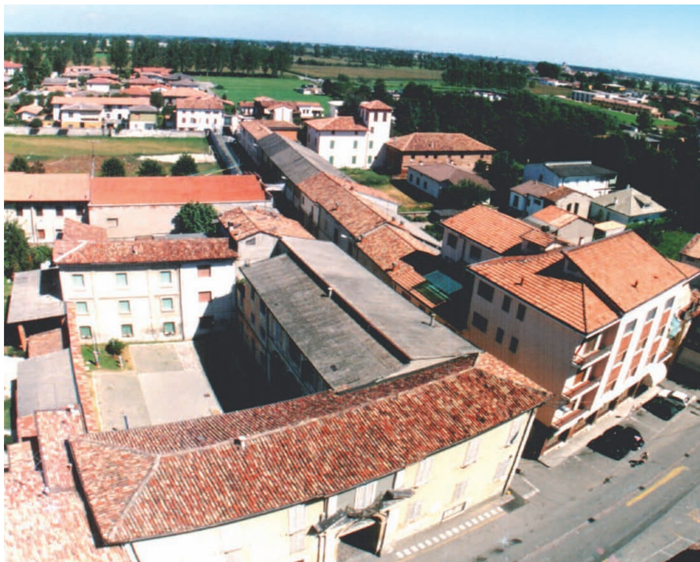
a cura dei CONSIGLIERI DI UDP

L'opposizione propone la vendita di una strada per finanziare la ciclabile per Bagnolo e la messa a norma delle scuole