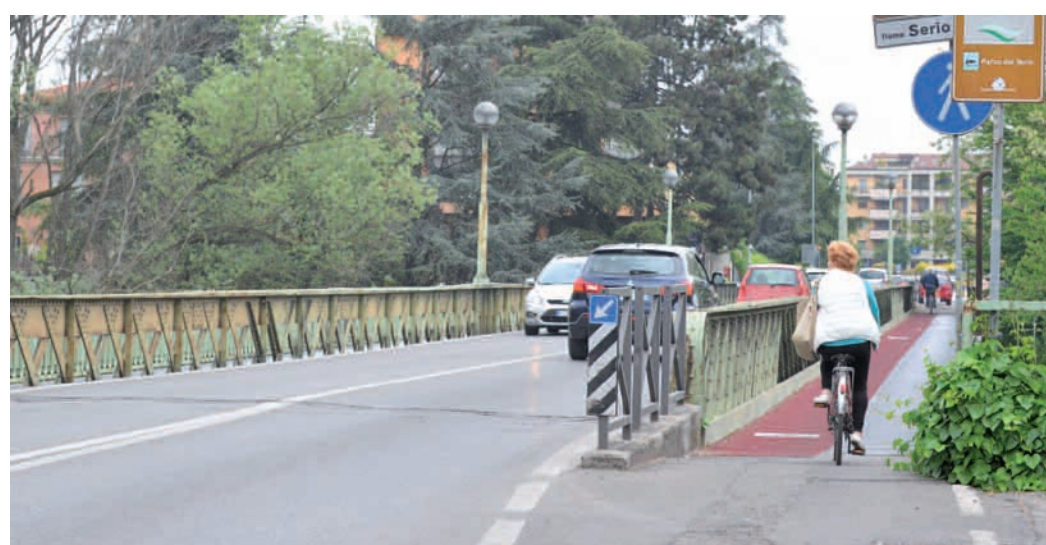
Ponte sul fiume Serio di via Cadorna