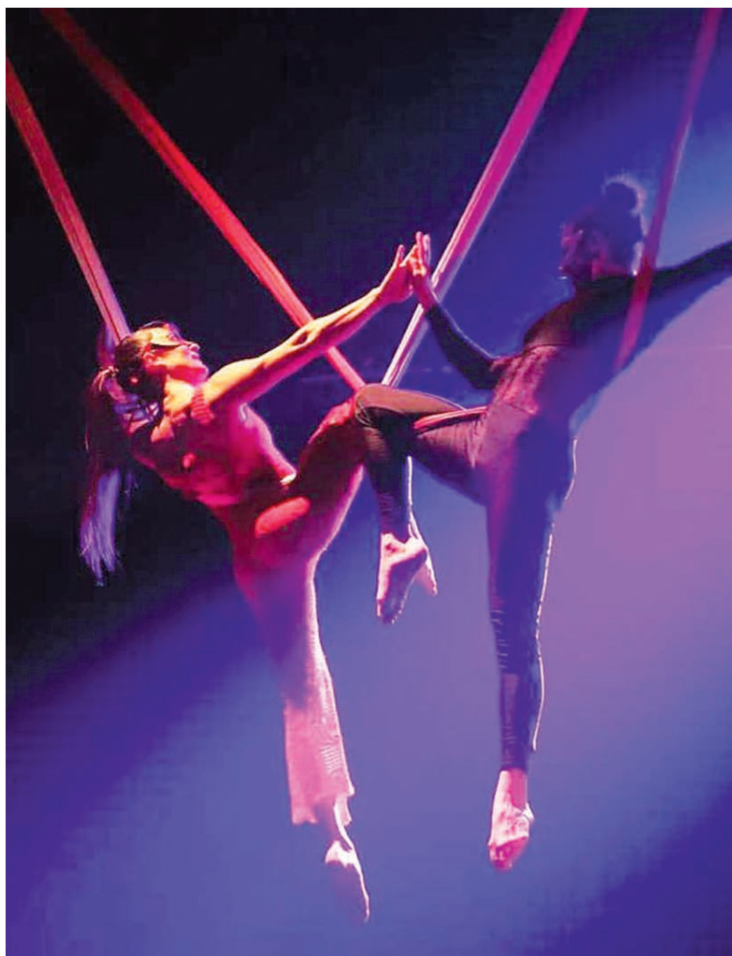
Sopra, la Compagnia dei Folli di Ascoli Piceno durante la terza edizione 2016 del Festival