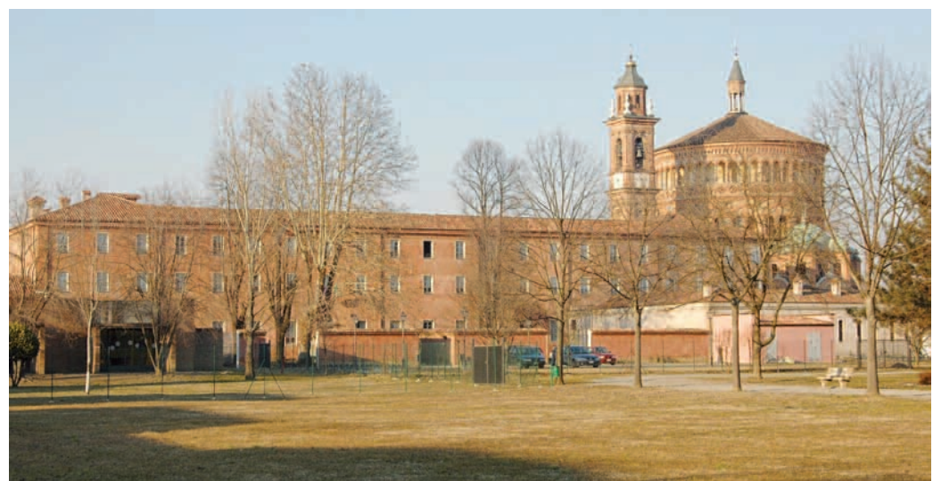
Parco comunale dell'ex nosocomio di Santa Maria