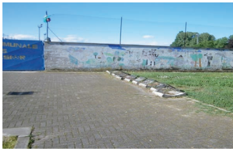
■ Entrata campo di calcio . Murales scrostati da anni.