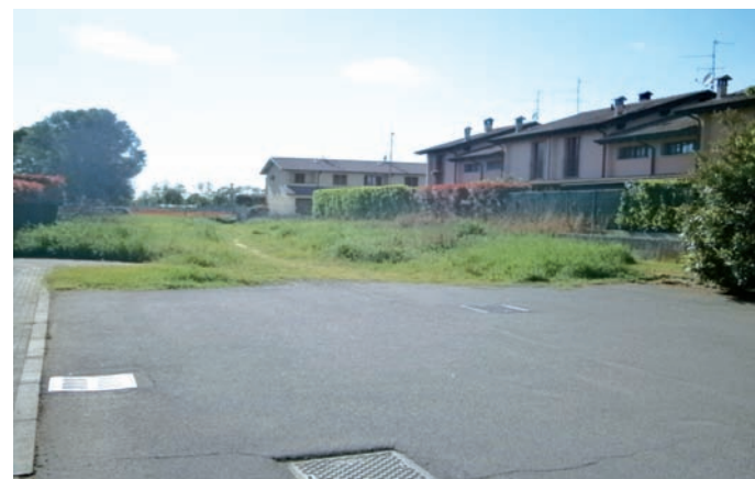
VIA MICHELANGELO E VIA CHE GUEVARA